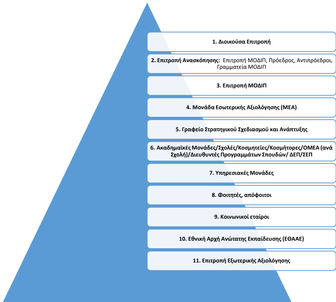
Εικόνα 2: Εμπλεκόμενα μέρη στο ΕΣΔΠ του ΕΑΠ